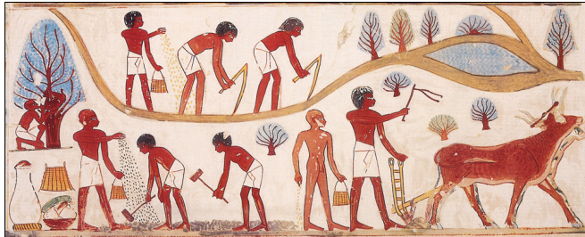
Bauern und Bäuerinnen

Schneide die Bilder aus, ordne sie und klebe sie im Skript auf Seite 15 ein.