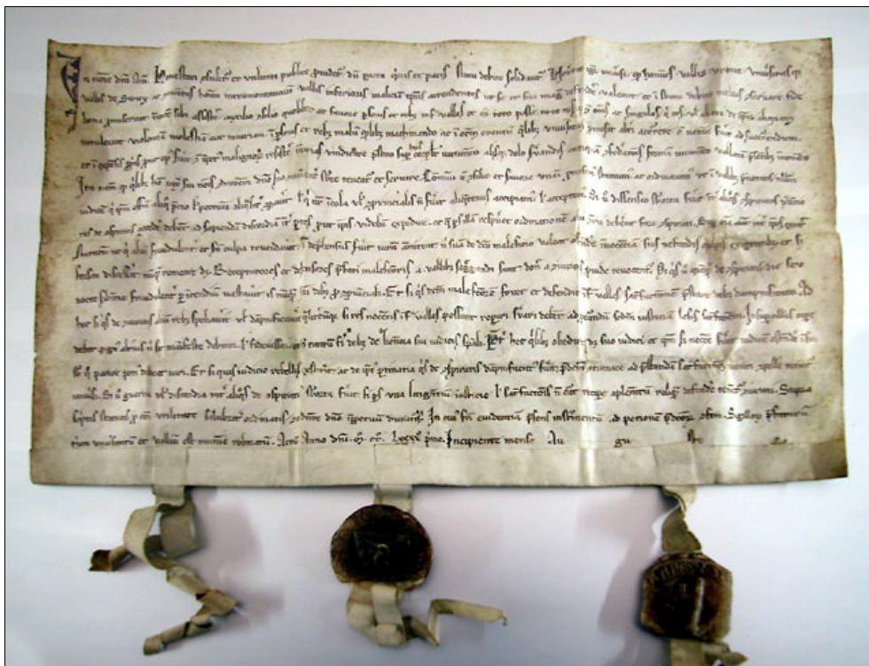
Ältester erhaltener Bundesbrief von Uri, Schwyz und Nidwalden, abgeschlossen Anfang August 1291, verfasst in Latein.

Obwohl der Herrscher über dieses Reich den Titel eines Königs und meist auch den eines Kaisers führte, war seine Macht stark begrenzt. Grosse und kleine Adelige, Bischöfe, Klöster und Städte strebten nach mehr Rechten und mehr Landbesitz. Dies führte zu zahlreichen Konflikten. Im Alpenraum war es für einen einzelnen Herrscher besonders schwierig, sich durchzusetzen. Kleine Adelige und freie Bauern bildeten hier „Talgemeinschaften“, z. B. diejenigen von Uri, Schwyz, Ob- und Nidwalden. Diese Talgemeinschaften versuchten, in ihrem Gebiet Sicherheit und Ordnung zu schaffen und nach aussen möglichst viel Selbstständigkeit zu gewinnen. Die einzelnen Talschaften waren aber zu klein, um ihre Ziele alleine zu erreichen. Sie schlossen Bündnisse, um die Ziele gemeinsam zu erreichen. Der älteste erhaltene Bund zwischen Uri, Schwyz und Nidwalden wurde im August 1291 besiegelt.