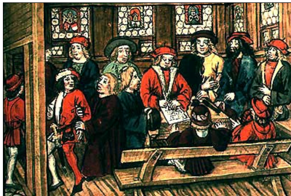
Die Verhandlungen der verstrittenen Bündnispartner in Stans.