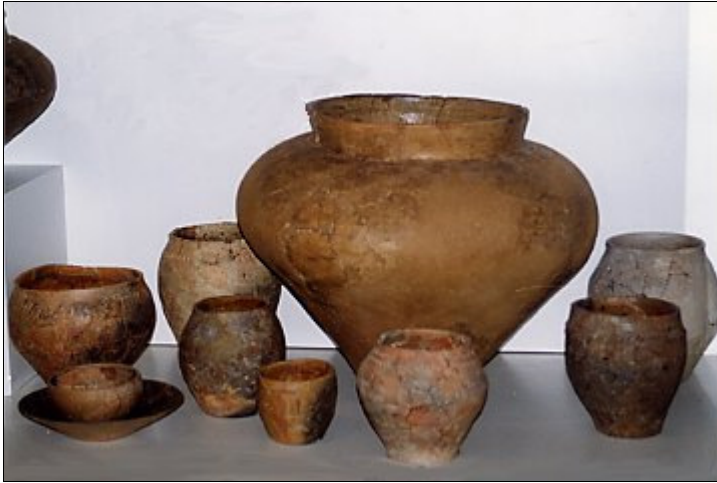
Keramik von der keltischen Heuneburg bei Hundesingen Nähe Sigmaringen.