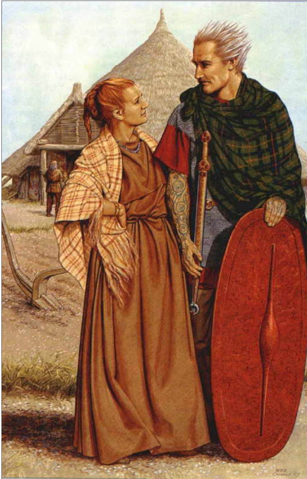
Britisches Adligenpaar um 200 V.Chr. (Peter Conolly).