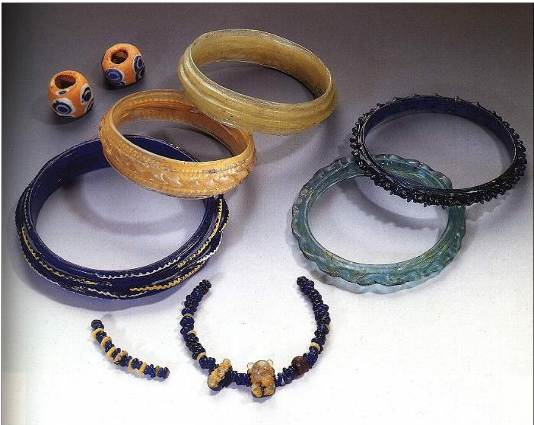
Glasarmringe aus latènezeitlichen Frauengräbern von Manching.