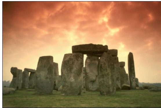
Stonehenge in England.

Das Halloween-Fest hat keltische Wurzeln und wurde von Iren nach Amerika gebracht.