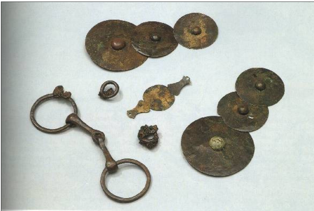
Pferdetrense aus Manching.