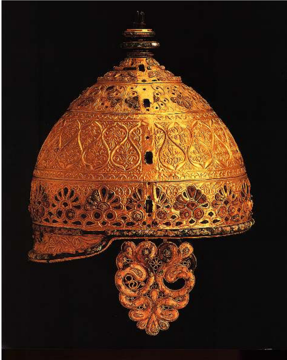
Prunkhelm von Agris.