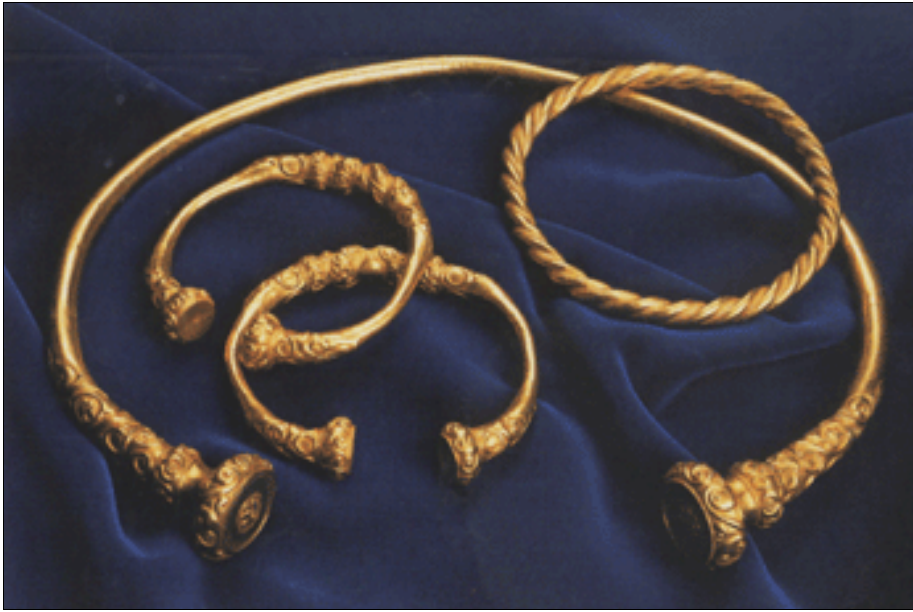
Schmuck aus Gold oder Bronze.