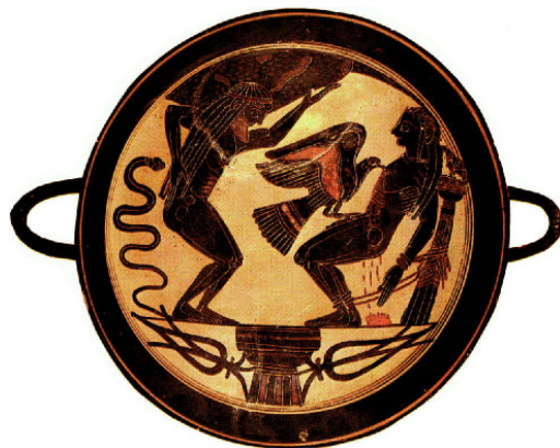
Atlas, der Adler Ethon und Prometheus; Lakonische Schale; ca. 555 v. Chr.

Jener Zeitpunkt erschien früher, als der Verurteilte nach dem Spruch des Göttervaters erwarten durfte. Als er viele Jahre an dem Felsen