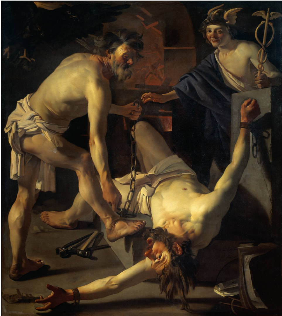
Dirck van Baburen (c. 1595-1624); Prometheus wird angekettet (1623); Ölgemälde, Rijksmuseum, Amsterdam.

Darauf wandte sich Zeus mit seiner Rache gegen Prometheus. Er übergab den Verbrecher dem Hephaistos und seinen Dienern, dem Kratos und der Bia (dem Zwang und der Gewalt). Diese mussten ihn in die skythischen Einöden schleppen und hier, über einem schauerhaften Abgrund, an eine Felswand des Berges Kaukasus mit unauflösllichen Ketten schmieden. Ungerne vollzog Hephaistos den Auftrag seines Vaters,