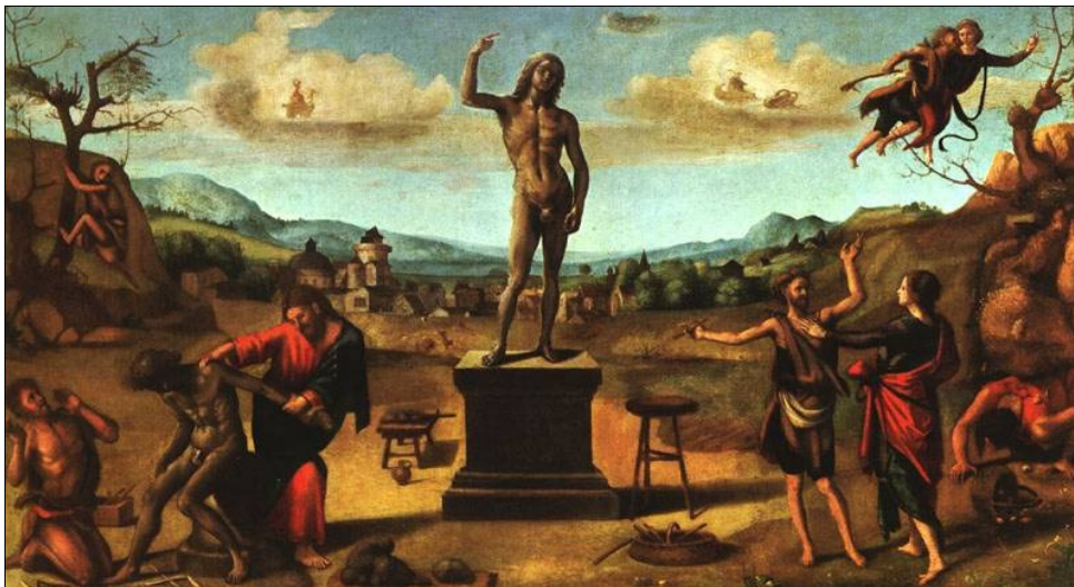
Piero di Cosimo (1462-1521), Der Mythos des Prometheus (1515); Ölgemälde.

Himmel und Erde waren geschaffen: das Meer wogte in seinen Ufern, und die Fische spielten darin; in den Lüften sangen beflügelt die Vögel; der Erdboden wimmelte von Tieren. Aber noch fehlte es an dem Geschöpfe, dessen Leib so beschaffen war, dass der Geist in ihm Wohnung machen und von ihm aus die Erdenwelt beherrschen konnte. Da betrat Prometheus die Erde, ein Sprössling des alten Göttergeschlechtes, das Zeus entthront hatte, ein Sohn des erdgeborenen Uranossohnes Iapetos, kluger Erfindung voll. Dieser wusste wohl, dass im Erdboden der Same des Himmels schlummerte; darum nahm er vom Tone, befeuchtete denselben mit dem Wasser des Flusses, knetete ihn und formte daraus ein Gebilde nach dem Ebenbilde der Götter, der Herren der Welt. Diesen seinen Erdenkloss zu beleben, entlehnte er allenthalben von den Tierseelen gute und böse Eigenschaften und schloss sie in die Brust des Menschen ein. Unter den Himmlischen hatte er eine Freundin, Athene, die Göttin der Weisheit. Diese bewunderte die Schöpfung des Titanensohnes und blies dem halbeseelten Bilde den Geist, den göttlichen Atem ein.