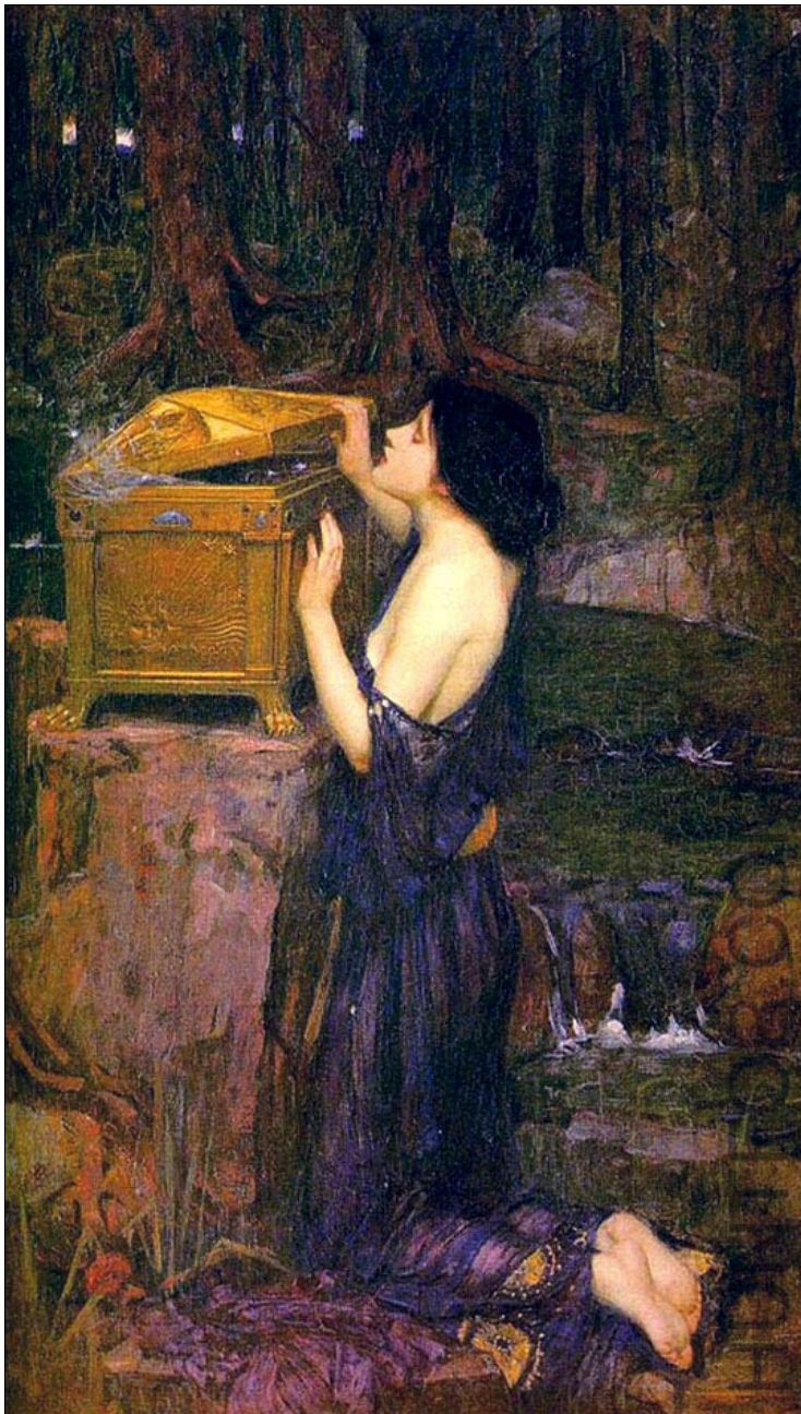
John William Waterhouse (1849-1917), Pandora (1896), Ölgemälde, private Sammlung.

schlug sie den Deckel zurück, und alsbald entflog dem Gefässe eine Schar von Übeln und verbreitete sich mit Blitzesschnelle über die Erde. Ein einziges Gut war zuunterst in dem Fasse verborgen, die Hoffnung; aber auf den Rat des Göttervaters warf Pandora den Deckel wieder zu, ehe sie herausflattern konnte, und verschloss sie für immer in dem Gefäss. Das Elend füllte inzwischen in allen Gestalten Erde, Luft und Meer. Die Krankheiten irrten bei Tag und bei Nacht unter den Menschen umher, heimlich und schweigend, denn Zeus hatte ihnen keine Stimme gegeben; eine Schar von Fiebern hielt die Erde belagert, und der Tod, früher nur langsam die Sterblichen beschleichend, beflügelte seinen Schritt.