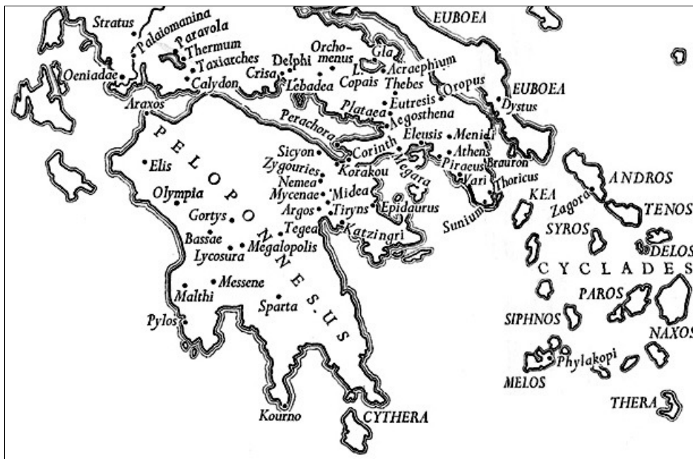
Sparta („die Gesäte“, „die Verstreute“) hiess bei Zeitgenossen meist Lakedaimon und das Land um Sparta Lakonien.

(Xenophon, Der Staat der Lakedaimonier , 1.1)