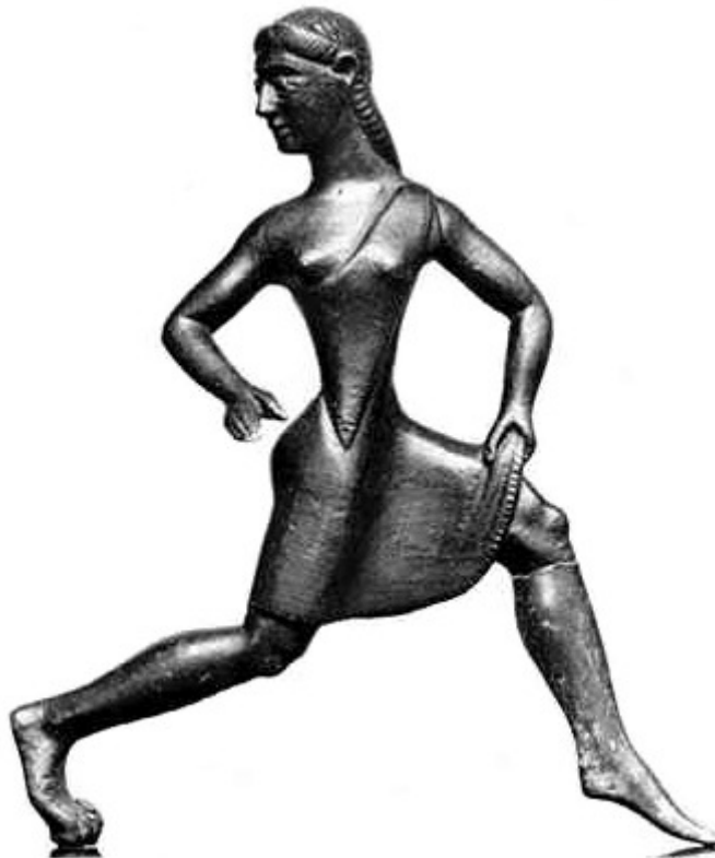
Junge Spartanerin, Bronzestatue.

Die Mädchen wurden wie die Jungen nach der Geburt einer „Tauglichkeitsprüfung“ unterzogen. Grundsätzlich galt auch bei den Mädchen dieselbe Sorgfalt bei der Erziehung wie bei den Knaben. Die Mädchen wurden ebenso in körperlicher Fitness trainiert und massen sich gegenseitig in Wettbewerben. Die Idee dahinter war laut Plutarch, der die Ideen Lykurgs wiedergab, dass starke Eltern ebenso starke Kinder zeugen würden. Die spartanischen Frauen waren für ihre durchtrainierten Körper in ganz Griechenland berühmt. Wie für die Knaben wurden Wettbewerbe für Mädchen und Frauen in den Rahmen religiöser Feste eingefügt. Einzig an den olympischen Spielen konnten die Frauen nicht teilnehmen.